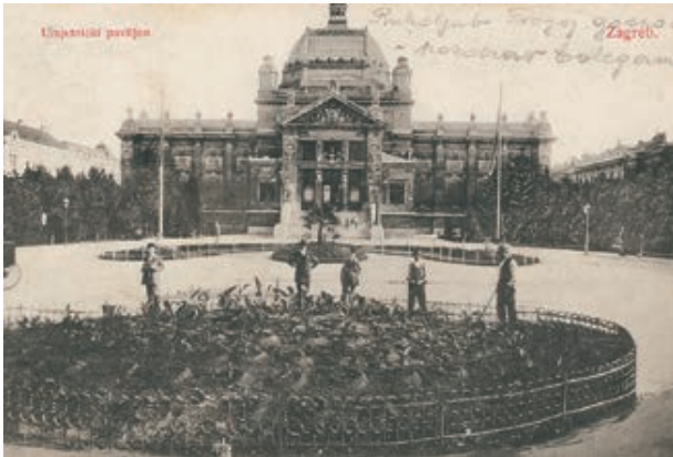
Sl. 1 – 2. Ilustracije uz predavanje dr. sc. Snješke Knežević: zagrebačka Zelena potkova u radobliju historizma (crno-bijela fotografija otisnuta na razglednici) i Zelena potkova danas (digitalna fotografija)