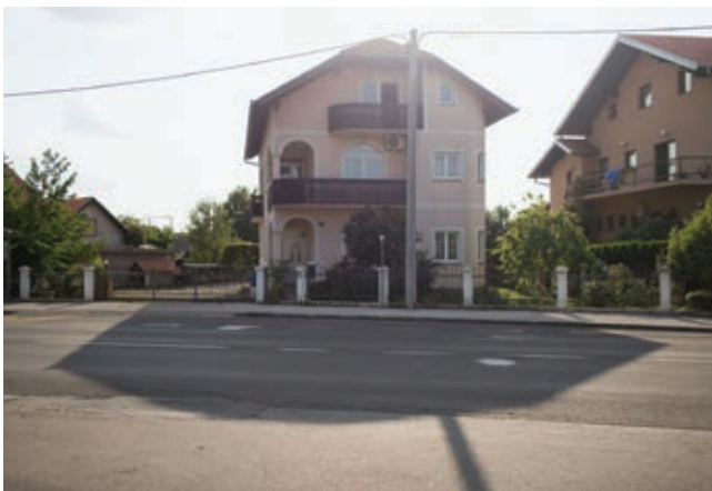
Sl. 4 - 5. Fotografije Marka Ercegovića iz 2018. za polaznike radionice; primjeri urbanističkih nesporazuma na razini vizualne komunikacije grada: ugaona kuća u Brezovici pored Zagreba i dućan u Stonu