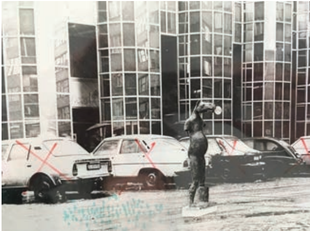
Sl. 2 – 3. Primjeri umjetnosti u javnom prostoru i muzealizacije umjetničkih djela: Ivan Kožarić, Divni stari konj, fotomontaža za Gajevu iz 1970-ih (MSU Zagreb), uz dvosatnu šetnju-predavanje Saše Šimprage; Slučajna čuvaonica, detalj izložbe u Modernoj galeriji (danas Nacionalnom muzeju moderne umjetnosti) u Zagrebu, 2020., uz predavanje ravnatelja Branka Franceschija