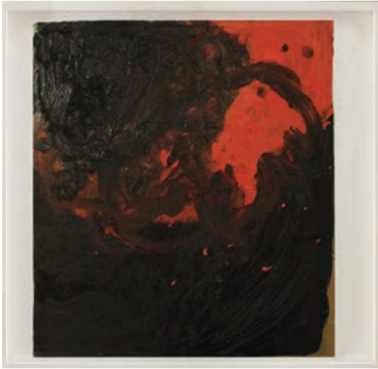
Sl. 11. Bez naziva, ulje na kartonu, 77 x 70 cm

plohe i dubine, u „produktivnoj napetosti“ 44 nesvodivosti detalja na kontekst? Naime, „plošna dubina“ karakteristična je za perspektivne slike, a mi taj odnos nesvodive razlike prepoznajemo u apstraktnim uslojavanjima mrlja, u formalizaciji slike koja podrazumijeva razumijevanje metaforičnosti slike pri gledanju: „to ima veze s rezonancijama, s vizualnim uzajamnim djelovanjima i iznenađujućim sintezama“. 45 U tom smislu, Boehm kasnije objašnjava, valja gledati slike koje formaliziraju taj odnos, za razliku od onih koje iluzioniraju „nešto prikazano“. 46 Slike Tanje Škrković poništavaju suvremenu uronjenost slika imitacije stvarnosti u stvarnost samu, kod nje factum i fictum ne konvergiraju. Utoliko njezine slike ne obnavljaju svoju povijesnu određenost, nego izazivaju promatrača da im imenuje smisao, ako već ne reagira na njih nekom vlastitom slikom.