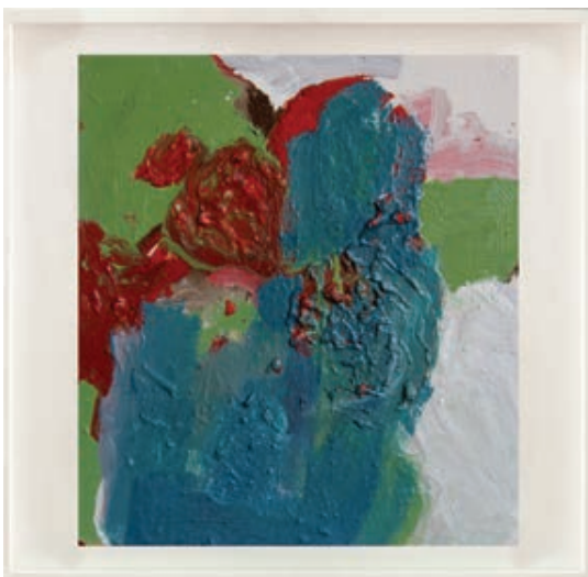
Sl. 9. Bez naziva, ulje na kartonu, 65 x 55 cm

li tražiti, kako Barthes piše, „pravu sliku“ koju zahtijeva „bol“? 39 Nema očevih fotografija iz djetinjstva; zato postoje očeve pripovijesti, zato u fotografiji koju posjedujem pretpostavljam sve ono što znam, što je pričao, što mu je bilo bitno. Rana smrt očeva oca sada je propinjanje u dostojanstvo bića koje prepoznajem u mentalnoj slici i bolnom prisjećanju na naša, obiteljska, zajednička prisjećanja na istu priču, istim ritualima: bilo je to opiranje zloći i zazivanje dobrote.