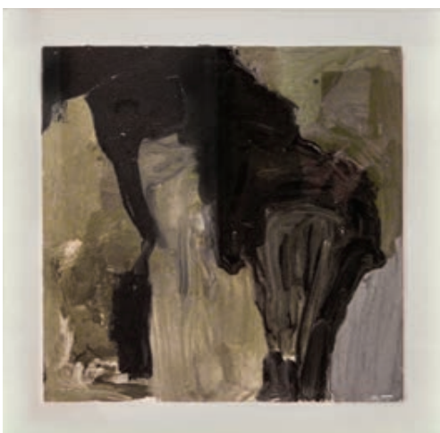
Sl. 3. Bez naziva, ulje na kartonu, III 52 x 53

odnosa kao nositelja identične emocije, uživljene u apstrakciju. Wilhelm Worringer, konačno, spaja te težnje (težnju uosjećavanju i težnju apstrakciji) kao povijesno ustanovljen manifest / apstrakcije / ekspresionizma.