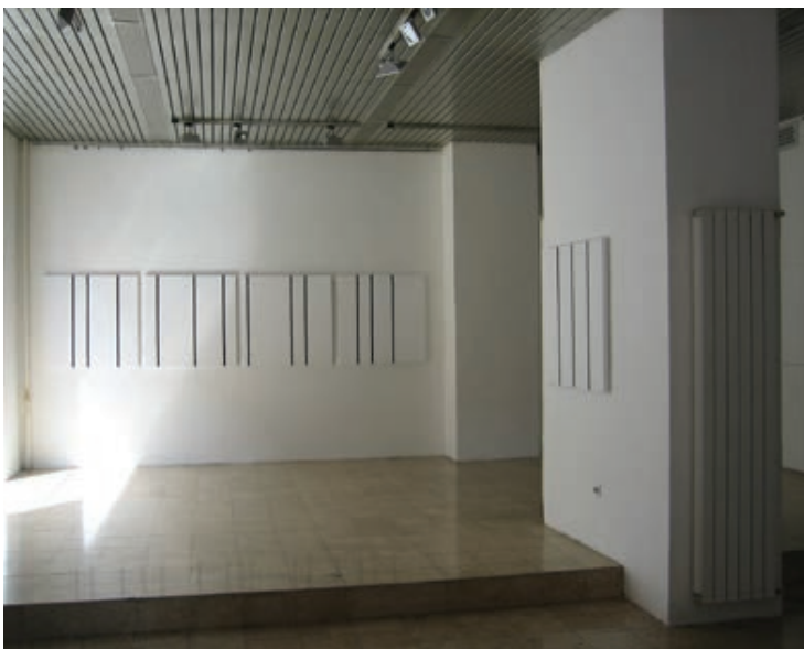
Sl. 20. Bez naziva, 75 x 75 cm, 2010.