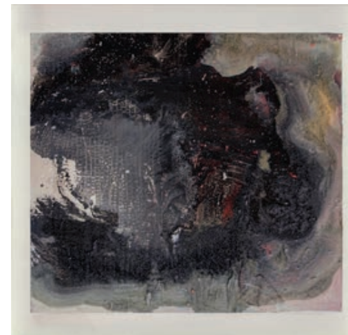
Sl. 6. Bez naziva, ulje na kartonu, 60,5 x 65,5 cm