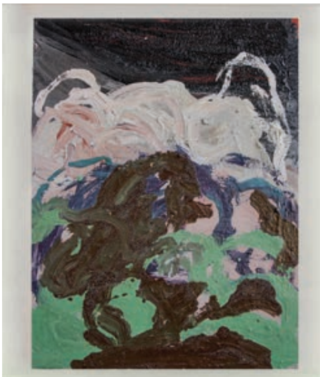
Sl. 7. Bez naziva, ulje na kartonu 64 x 50 cm