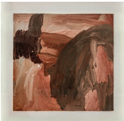
Sl. 2. Bez naziva, ulje na kartonu II, 52 x 53 cm