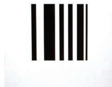
Sl. 14. Negativ, 50 x 50 cm, 2002.