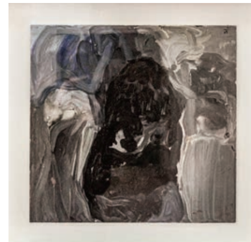
Sl. 1. Bez naziva, ulje na kartonu, 52 x 53 cm

svoju znamenitu tezu o ikoničkoj razlici kao bitnom svojstvu slike (nastojeći se odmaknuti od tradicionalne povijesti umjetnosti), te u kontekstu punctuma Rolanda Barthesa, došli smo do naizgled kontradiktornog uvida: ponajprije, i apstraktna slika može, uključivanjem metaforičnosti kao bitnog kriterija, postati nositeljem znaka stvarnoga, organskoga i realnoga, a potom i fotografija u svojem bitnom reprezentacijskom i figurativnom određenju može se pretvoriti u apstrakciju. To je moguće zahvaljujući istodobnom djelovanju suprotstavljenih, ali podjednako subjektivnih energija: ne samo one koja medij fotografije određuje kao „irealnost“ 5 , koju ovdje tumačimo kao apstrakciju, i ne samo stoga što fotografije postoje kao metafore (primjerice, fotografija kao metafora ambivalentnog tumačenja trenutka kod Bernda Stieglera) 6 , nego i zato što djelovanjem posve osobnoga, duboko emotivno proživljenog iskustva gubitka čovjek može biti doveden do bolnog sudara nakon kojega se intenzivno promatranje fotografije počinje pretvarati u memoriju i mišljenje. Na ovome mjestu definiramo punctum kao metaforu i kao apstrakciju, s obzirom na neposredan doživljaj emocije i s obzirom na određenje metafore kao nepotpunosti, otvorenosti i mnogoznačnosti forme. No apstraktnu sliku definiramo i kao punctum jer sadrži „produktivnu napetost“ formalnih