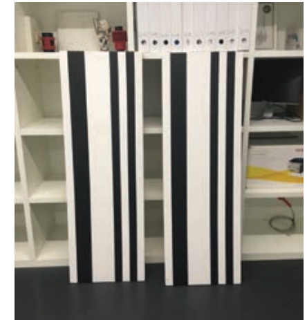
Sl. 16. Bez naziva, 2 x 150 x 50 cm, 2019.

je tijelo promijenilo stavova i gesti, pokreta, svijanja, položaja i kretnji slijeva udesno i nazad, do sredine i dolje, do granica lijevo i desno te preko njih. Bralić se bavi geometrijskim slikarstvom. Sve je svedeno na minimalne pomake, ali su oni vibrantni i percepcija tih promišljenih pomaka u kompoziciji slika navodi promatrača da počinje gledati vibracije koje organizacija uzdužnih oplošja tvori u svojoj izmjeničnosti – prema prostoru i u njega, te prema promatraču. Tu vidim osnovu za usporedbu s Bubašnim performansom i s definicijom „slikovnog čina“ kako ga tumači Bredekamp. No drugi pogled i usporedba dviju vrsta performativnosti dovodi do zaključka kako u primjeru slike tek valja istražiti identitetsku razinu te vrijednosti. To nas vodi prema još jednom uvidu iz navedenoga Bredekampova teksta. Naime, o dvojakosti Platonova razumijevanja slike – istovremeno ograničenja i zabrane, zbog osjetilnosti spram imitacije koja zavarava, dakle, prevaram spram stvarnosti i transcendentnih vrijednosti kojih bez slike ne bi bilo.