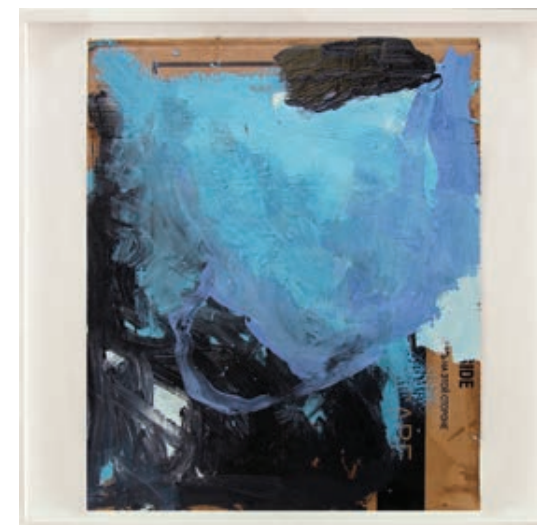
Sl. 10. Bez naziva, ulje na kartonu, 77 x 70 cm

je unaprijed prekinuta, prepoznamo Barthesov „udarac“ punctuma , pa posredno i Barthesova povezivanja fotografije sa slikom, poput čišćenja savjesti što se bavi fotografijom, kao da se radi o manje važnom mediju, imitaciji slike. Ipak, ta „sablast slikarstva“ pretvara fotografiju u istovrsnost slici jer je podjednako realistična, stvarajući iz slikarstva „pokroviteljsku Referencu“ 41 (Sl. 9, 10 i 11). I za Boehma se ne radi o prikupljanju detalja, nego o „jedinstvima“ kad je riječ o slici: sukcesija slike istovremena je njezin simultaniteta, kao što smo već primijetili. No sada imamo uvid u fotografsku metaforu slijeda (misli) i simultaniteta (emocija). Jedino tako, možemo misliti u slici metaforu koju je sam Boehm odredio kao ikoničku razliku, istovremenu materijalnost i nadmašenost svega činjeničnoga. Otuda bliskost s jezičnim, a ipak samo iz slikovnog mišljenja – kako Boehm piše: što može jezik, može i slika, samo na svoj način – proizlazi tzv. „struktura kontrasta“, spoj i razjedinjenost između „jezičnih slika (kao metafora)“ i „slike u smislu likovne umjetnosti“. 42 Otuda bliskost umjetnosti i života, primjećujemo, jer „pikturalna razlika“ dopušta da se ono svakodnevno doživljeno i viđeno pretvori u omeđenost „polja slike“, slike kao umjetničkog djela, „kao posuda, kao gravira“. 43