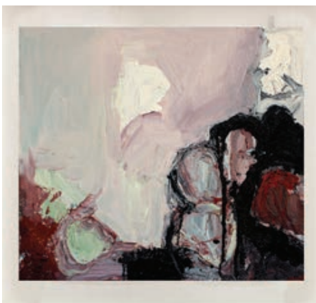
Sl. 8. Bez naziva, ulje na kartonu, 50 x 69 cm

ča i može biti podjednako opisano kao prolaznost ili trajanje 17 . Ovaj autor piše o tome kako slikar vidi fotografiju, kao istinu ili kao laž, uspoređujući Mareyevu otkriće perzistencije vida (a prema kojoj se brzi pokreti percipiraju kao kontinuitet) s Muybridgeovim otkrićem trenutka odvojenosti konja od tla, te ih stavlja u kontekst Rodinova iskaza o tome kako „fotografija laže“ jer „u stvarnosti vrijeme ne stoji“, a slikarsko je vrijeme stvaranja manje „konvencionalno“ od „znanstveno točne slike“ 18 . Čini nam se da je dovode-