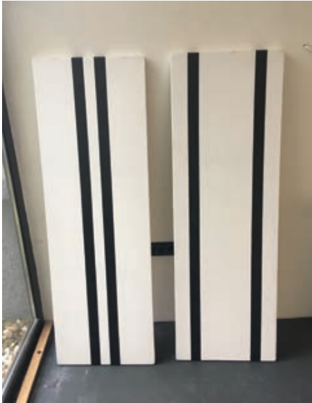
Sl. 17. Bez naziva, 2 x 150 x 50 cm, 2019.