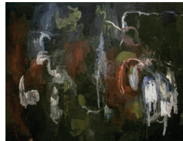
Sl. 4. Bez naziva, ulje na platnu, 130 x 170 cm

punctuma , kako je u mediju fotografije formulira Roland Barthes i kako se slikarska apstrakcija dovodi u vezu s onom fotografskom – to su pitanja koja pred nas postavljaju najnovija platna Tanje Škrgatić (Sl. 2). Nazvala bih te male slike na kartonima izljevima , uslojavanjima i nakupinama (Sl. 3). Sve, osim velike crne slike, koju ne prepoznajem osim kao smrt (Sl. 4), zbog koje mi je Barthesova teorija punctuma toliko bliska. Izgubiti blisku osobu i gledati je na fotografiji znači ujedno prepoznavati u apstrakciji sav življeni život sebe i toga drugog koji ostaje prisutan gotovo tjelesno u tim slikama, kao da su fotografije. Kako je to moguće?