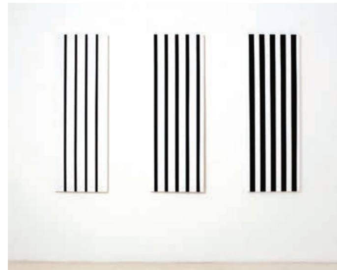
Sl. 19. Bez naziva, 3 x 150 x 50 cm, 2011.

Naravno, za izvođenje takvog epistemološkog obrata trebat će sagledati mogućnost da ova umjetnica ne pripada „tradiciji“ geometrijske apstrakcije, s izvorom u slikarstvu kao što je ono Kniferovo. Trebat će sagledati njezino djelo izvan konteksta morfološke bliskosti primarnom, analitičkom slikarstvu, u Hrvatskoj intenzivno prisutnom u drugoj polovini 70-ih godina. Godine 2011. Bralić izlaže, među ostalim, tri slike naglašeno uzdužnog formata (Sl. 19), poput (za nju karakteristične) serije: od najužih (najtanjih) četiriju do najširih (najdebljih) linija. Nude li one neku vrstu čitanja u prostoru? Da, ali sada vidimo slijed od jedne površine do druge, ne kao utjecaj na prostor, ne kao nešto što ovisi isključivo o promatraču. Dolazi do zgušnjavanja u nizu, do popune triju nanizanih ploha koje tek u takvom nizu čine cjelinu. Skloni smo taj niz nazvati ornamentiranjem. Zato što je s tri uzdužna, odvojena platna načinila veću cjelinu, unutar koje nije moguće zamijeniti mjesta dijelovima, jer su artikulirani upravo unutar tih granica, oplošja i dimenzija.