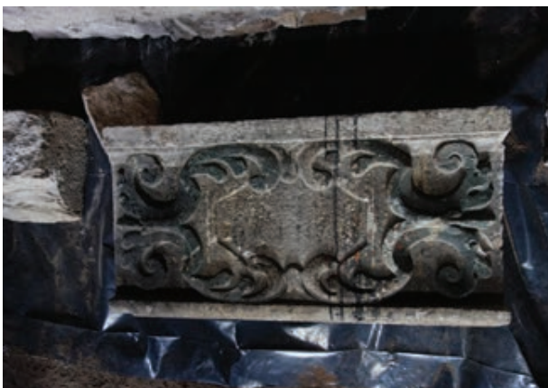
Sl. 3. Postolje za skulpturu s nekadašnjega glavnog oltara u špilji sv. Ante