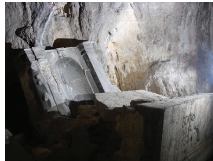
Sl. 1. Barokni glavni oltar u špilji sv. Ante u kanalu rijeke Krke, Ante nakon rastavljanja

mogli bismo ga opisati kao oltar tipa edikule s udvostručenim pilastrima koji naglašavaju edikulu, odnosno uokviruju nišu za skulpturu. U niši unutar edikule toskanskog tipa nekoć se nalazio kip, poslije prenesen u tvrđavu sv. Nikole. 57