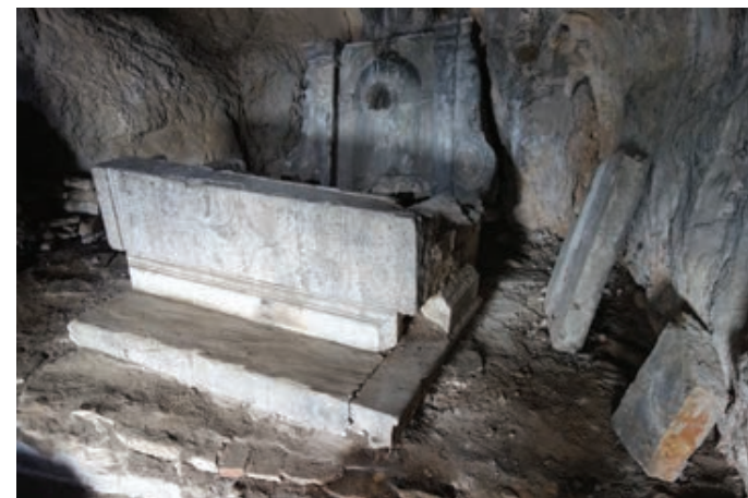
Sl. 5. Današnji izgled glavnog oltara u špilji sv. Ante u kanalu sv. Ante